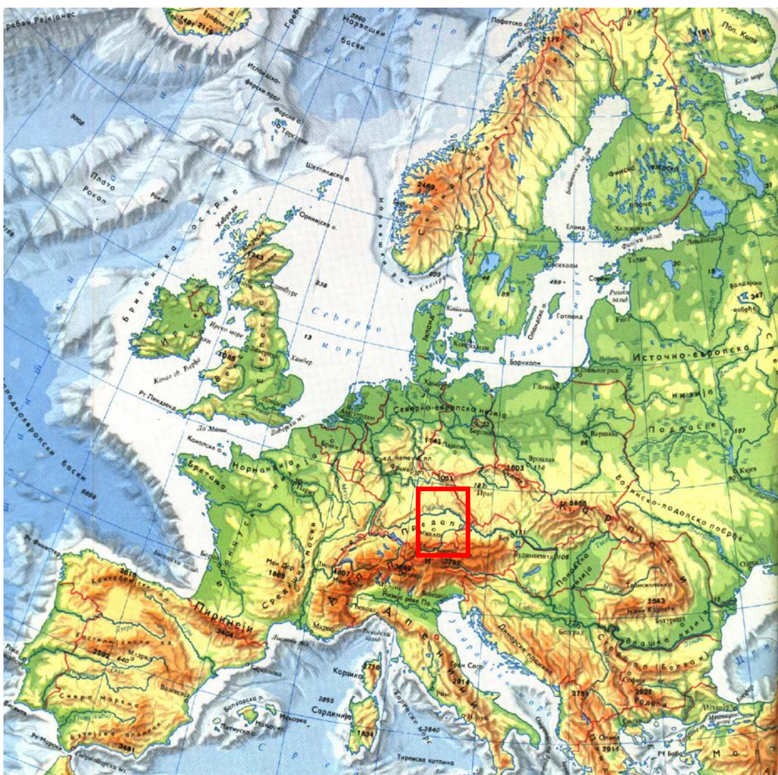
Карта 1. Положај Баварске у оквиру Европе (размера: 1 cm = 180 km)