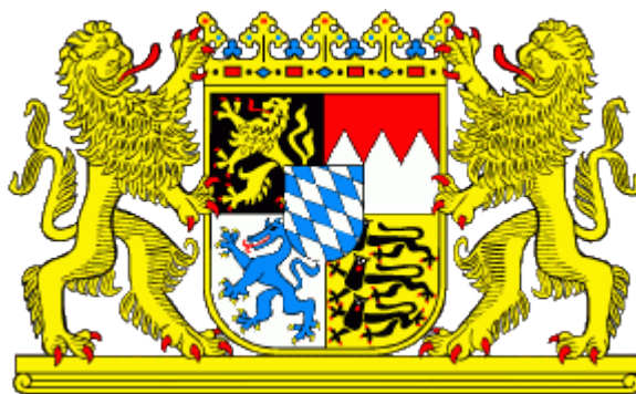
Слика 1. Грб Баварске, Извор: www.bayern.de

Да би приказ туризма Баварске био што потпунији извршена су одређена теренска истраживања и аналитичко-синтетички приказ појединих елемената природе, друштва, културно-историјских и других вредности. Уз коришћење доступне литературе и одговарајућих извора, целовитост рада постигнута је уз примену картографског, графичког, статистичког, компаративног и метода критичности.